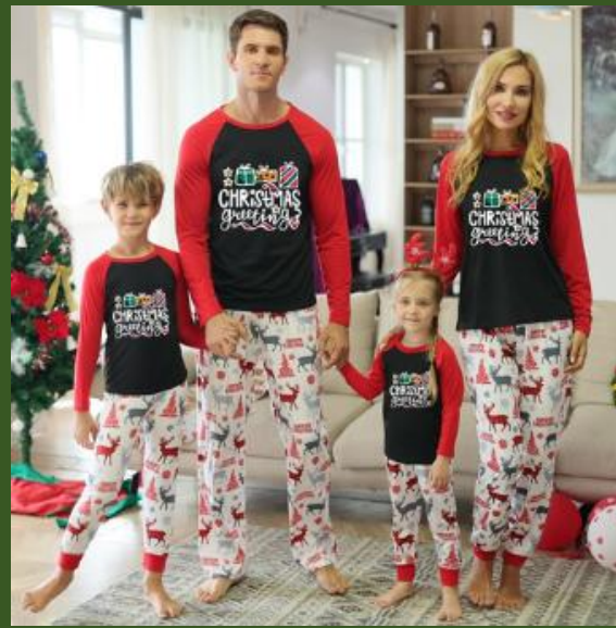
NH10030399 Ventes 134