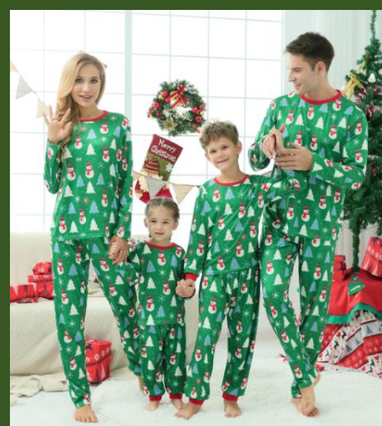
NH10030382 Ventes 96