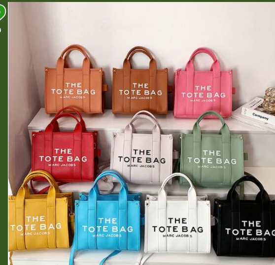
NH865206 Ventes 855