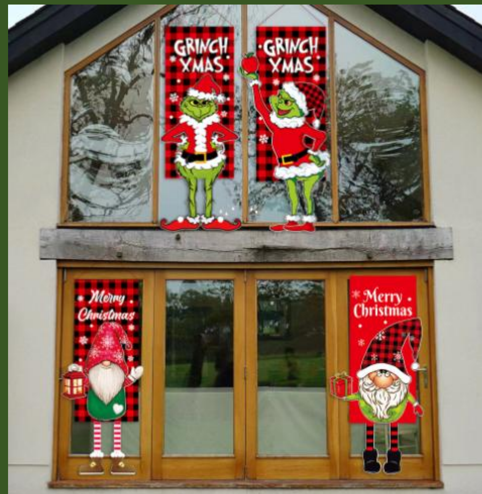
NH10049237 Ventes 258

https://www.nihaojewelry.com/fr/deco-maison