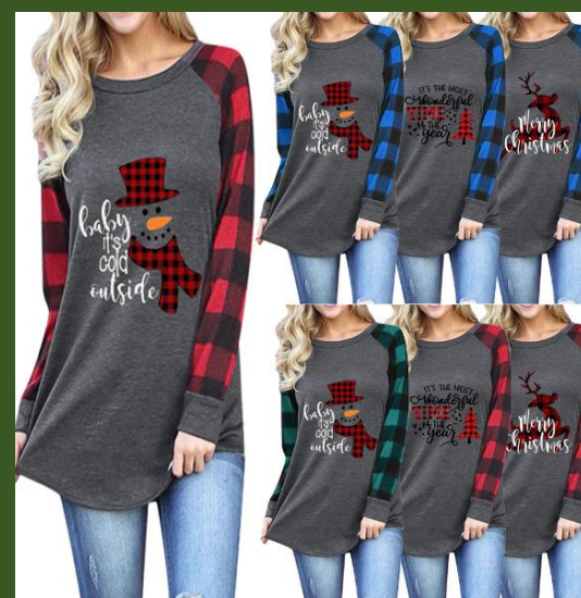
NH10046767 Ventes 127