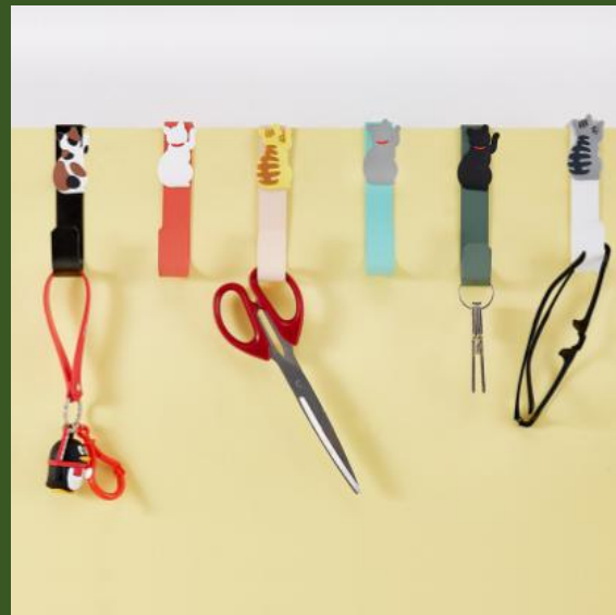
NH10081166 Ventes 96