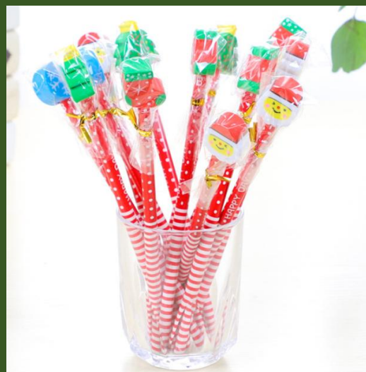
NH10040650 Ventes 502