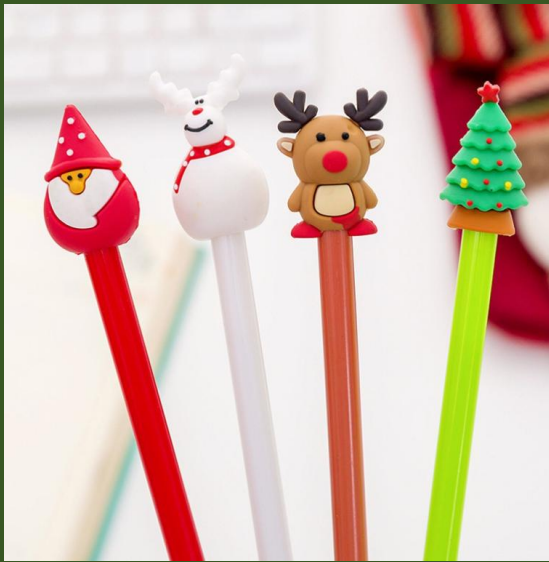
NH10040691 Ventes 900