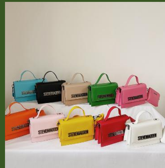
NH865232S Ventes 194