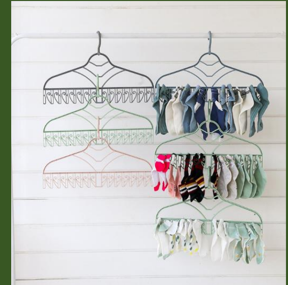
NH10081150 Ventes 88