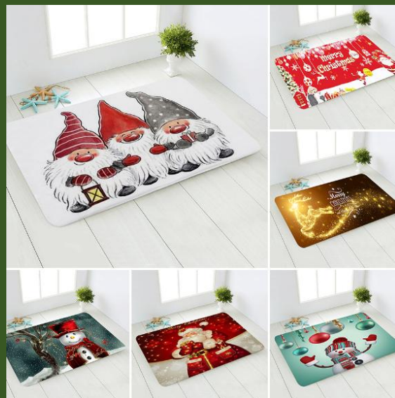
NH10041565 Ventes 189