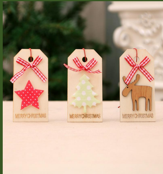
NHMV176270 Ventes 530