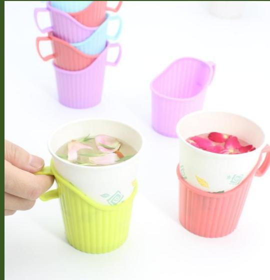
NH10083454 Ventes 85