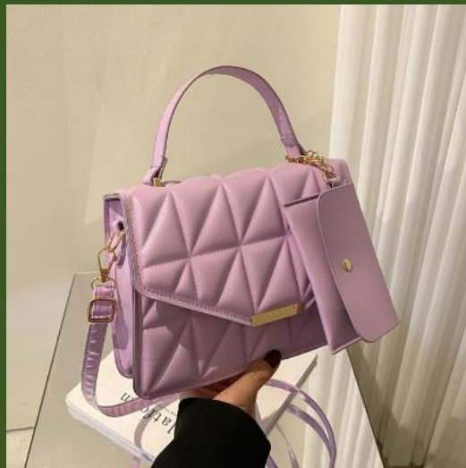
NH1003847 Ventes 242