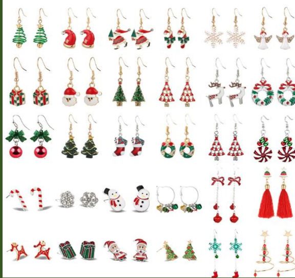
NH10006583 Ventes 861