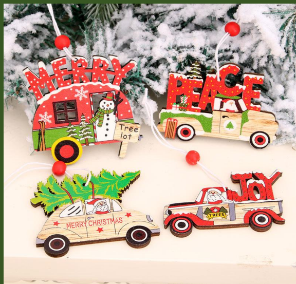
NHNV256582 Ventes 863