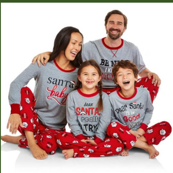
NH10057239 Ventes 86