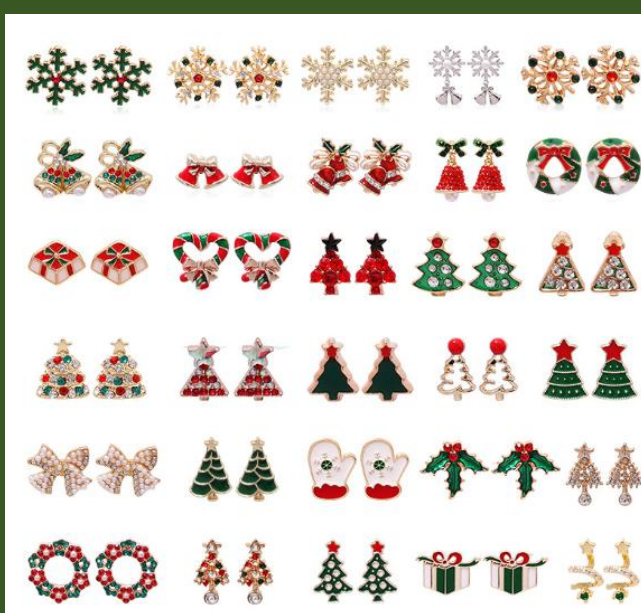
NH10006585 Ventes 465