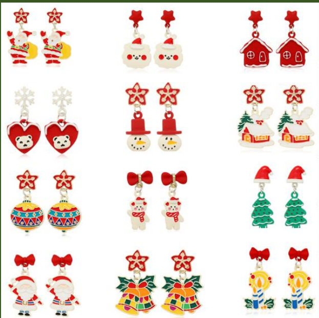
NH10049667 Ventes 437