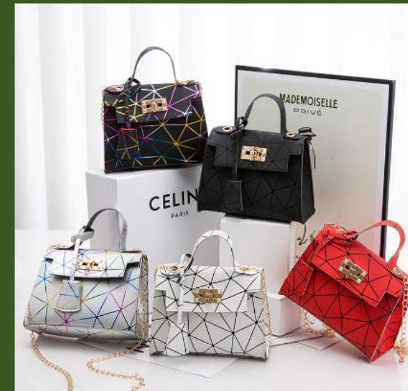
NH10001421 Ventes 140