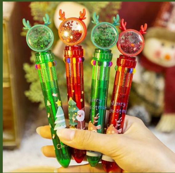
NH10060886 Ventes 396