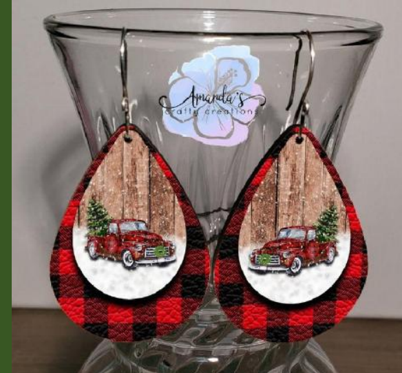
NHQIY421666 Ventes 491