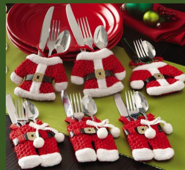
NH10049343 Ventes 96