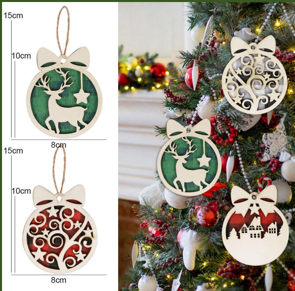
NH859225 Ventes 718