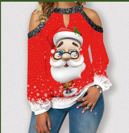
NH10048160 Ventes 118