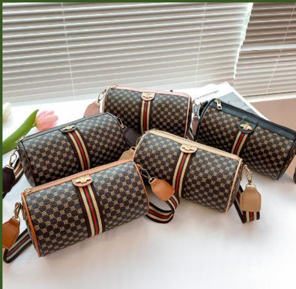
ND853007 Ventes 158