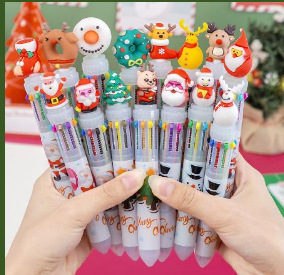
NH10069976 Ventes 323