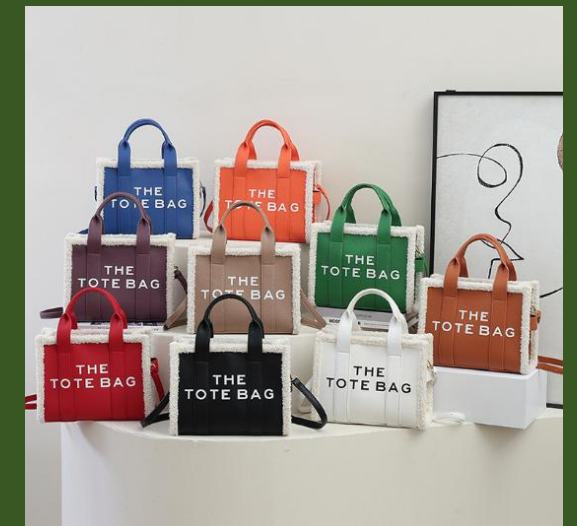
NH10037304 Ventes 303

https://www.nihaojewelry.com/fr/sacs-a-la-mode