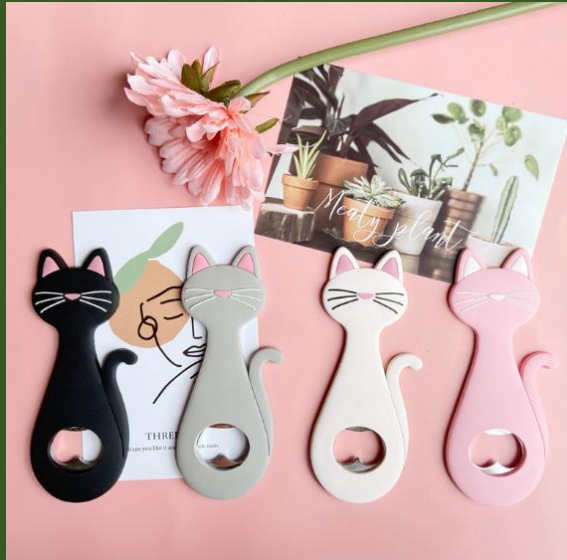
NH10081294 Ventes 98