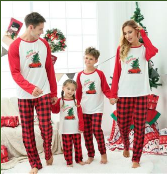
NH10030404 Ventes 154