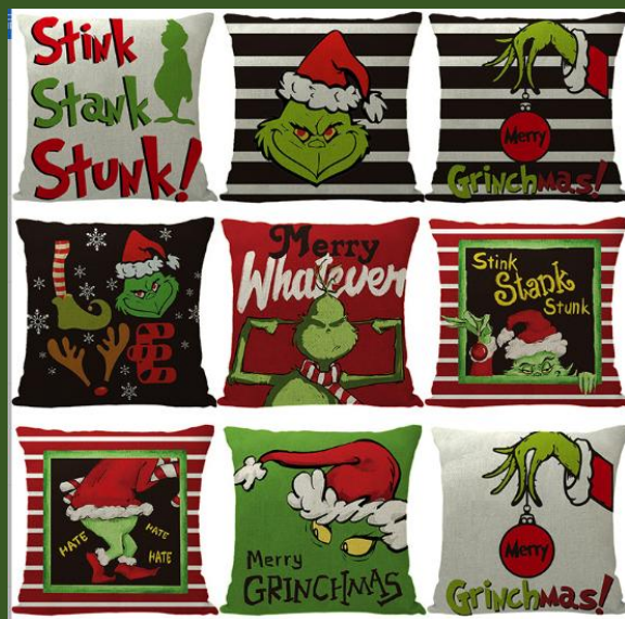
NH10060148 Ventes 194