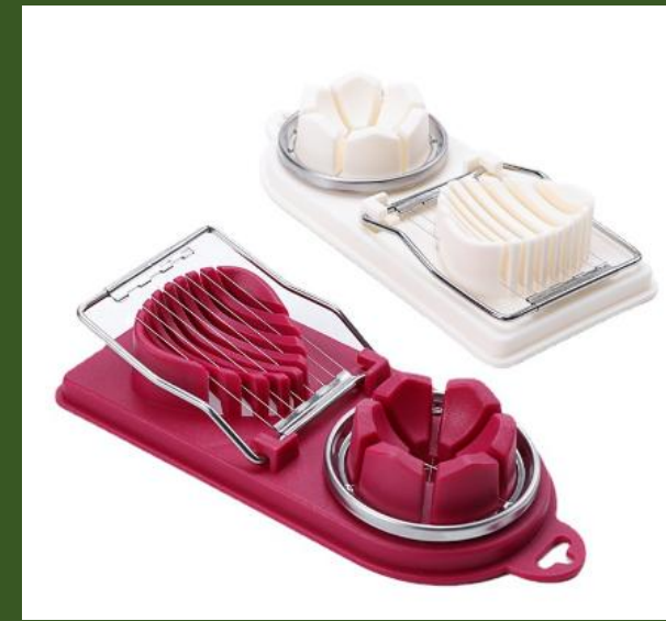
NH10083515 Ventes 90