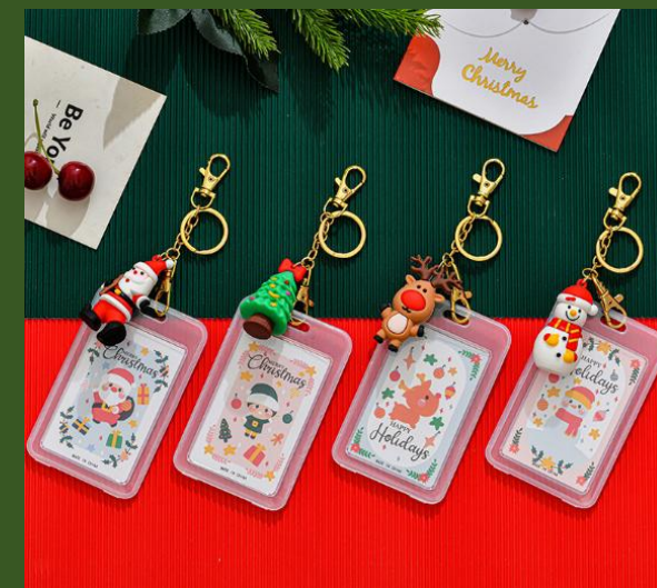
NH10057283 Ventes 69