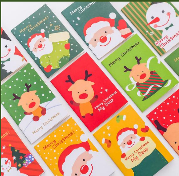
NH848281 Ventes 322