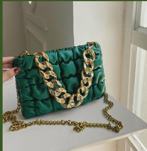
NH10023079 Ventes 191