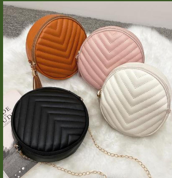
NH816680 Ventes 159