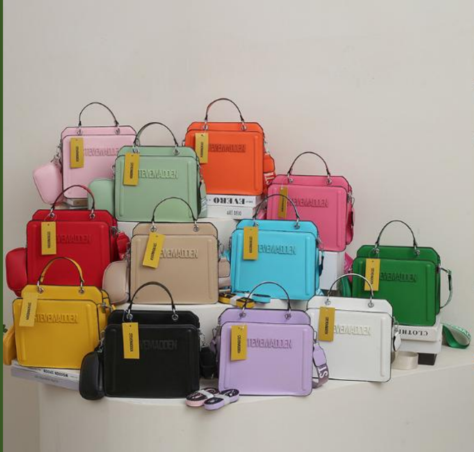
NH852842 Ventes 945