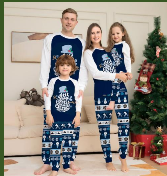
NH10035591 Ventes 75