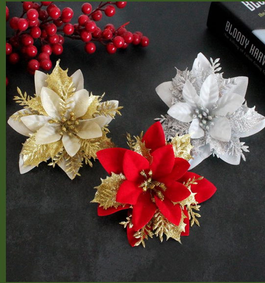
NHGAL419301 Ventes 475