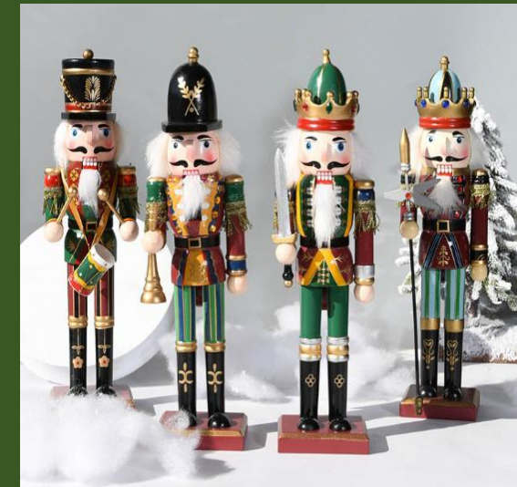
NH10058050 Ventes 134