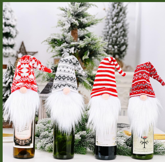
NHNB291381 Ventes 844