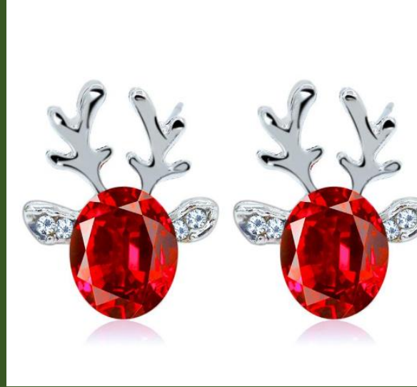
NHDP153030 Ventes 548