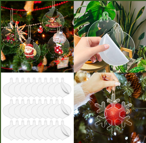
NH10030839 Ventes 540