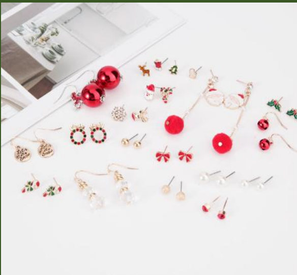
NH10041454 Ventes 564