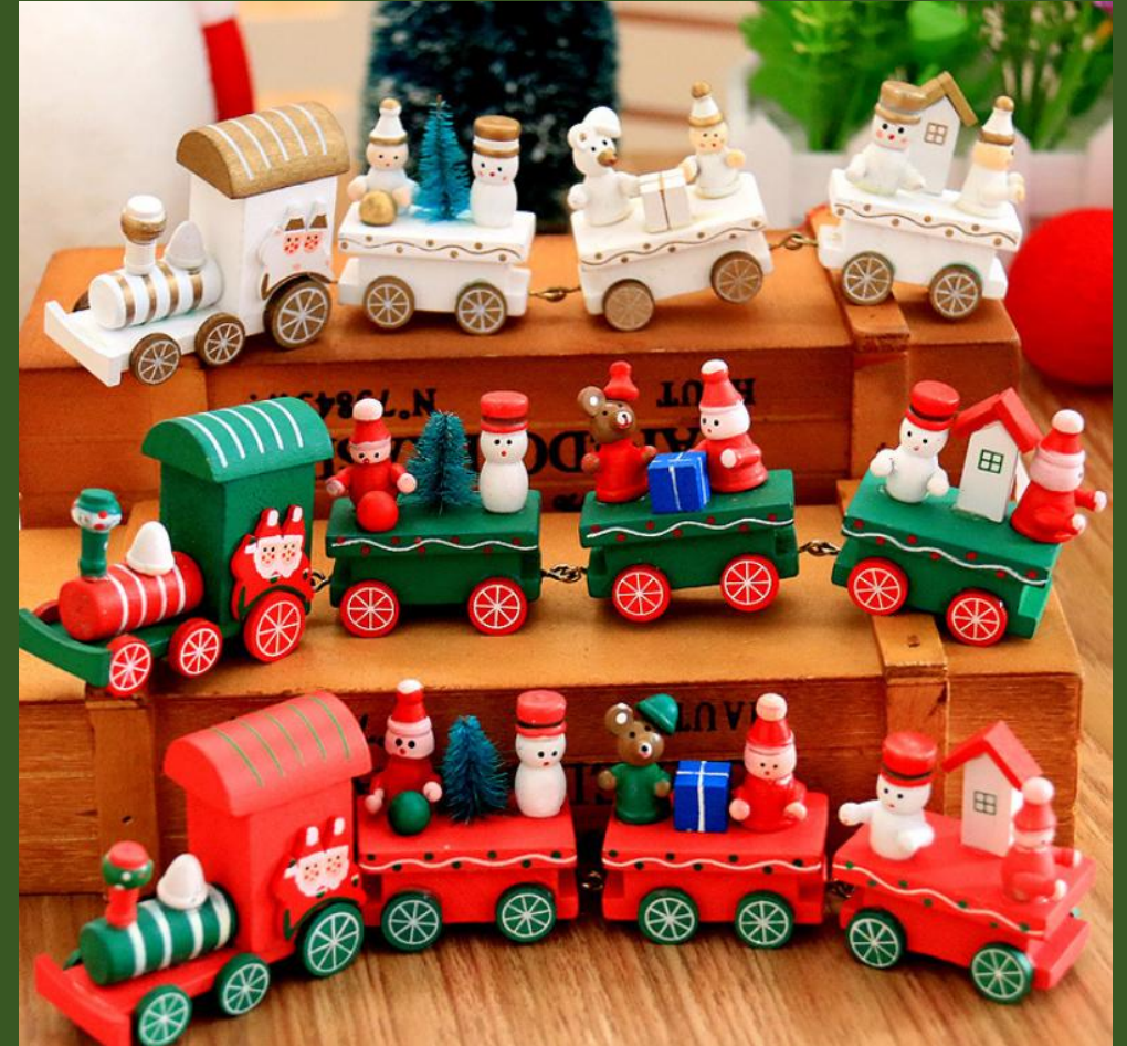
NH10049471 Ventes 206