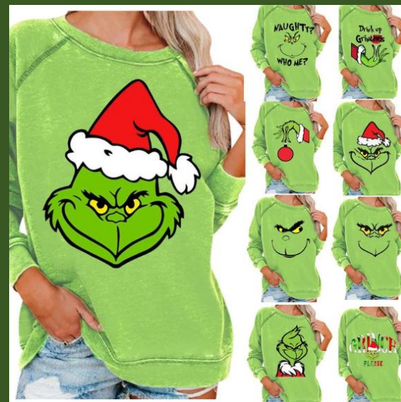
NH10055541 Ventes 112