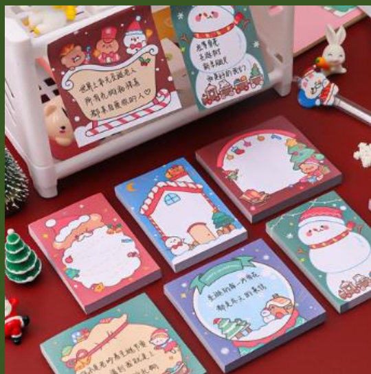
NH10030809 Ventes 525