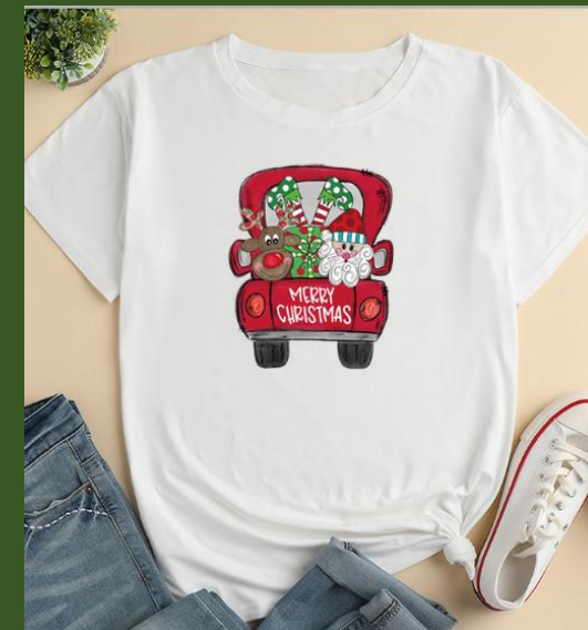
NH10034367 Ventes 133