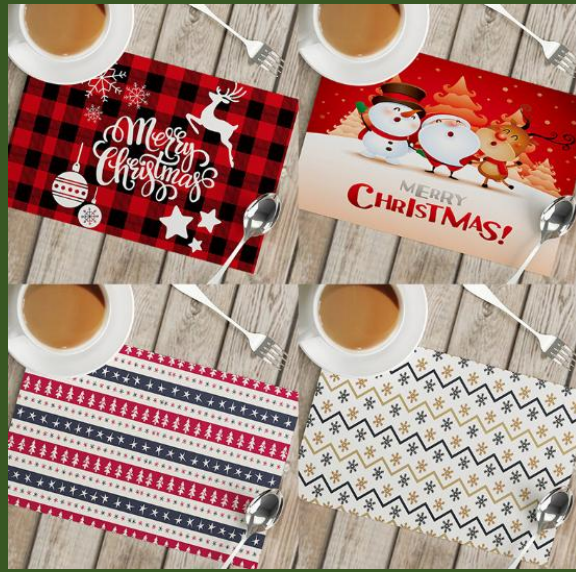
NH10057345 Ventes 246