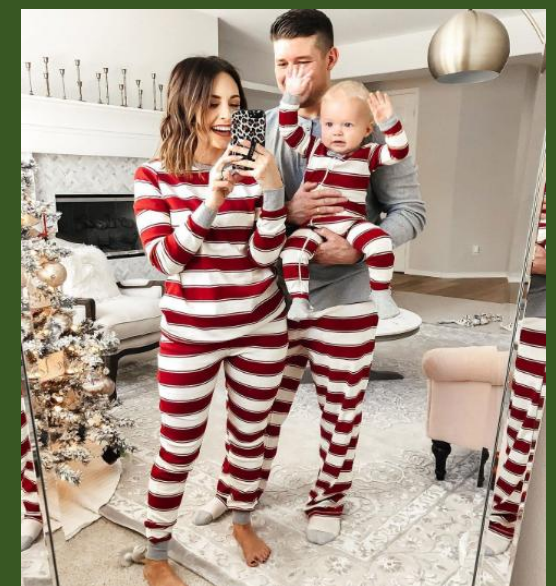
NH10050699 Ventes 75