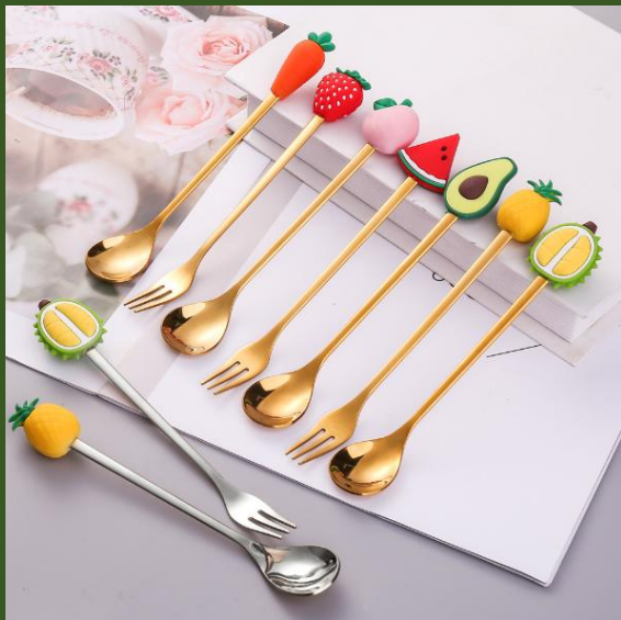
NH1006665 Ventes 123