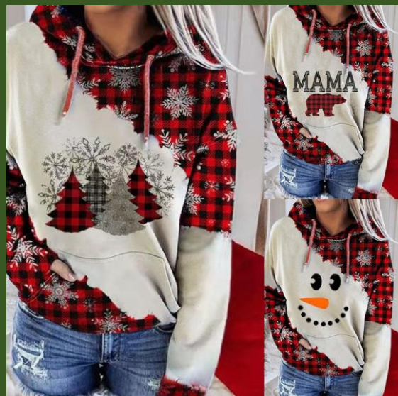
NH10055522 Ventes 117