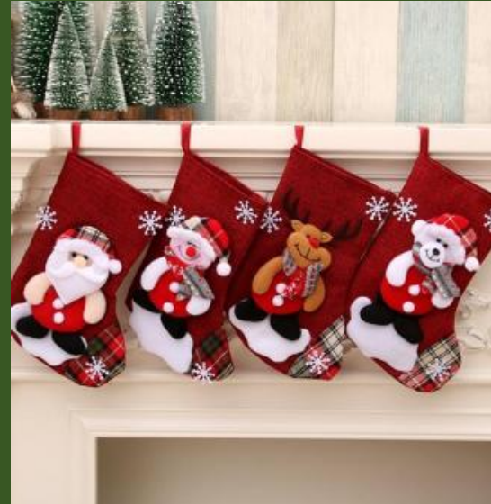
NHMV155603 Ventes 188