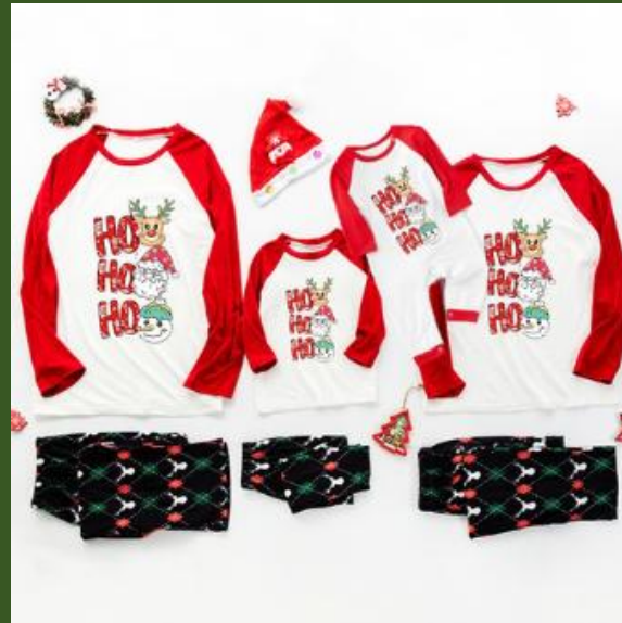
NH10030405 Ventes 133