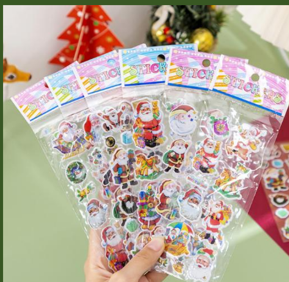
NH10058711 Ventes 170