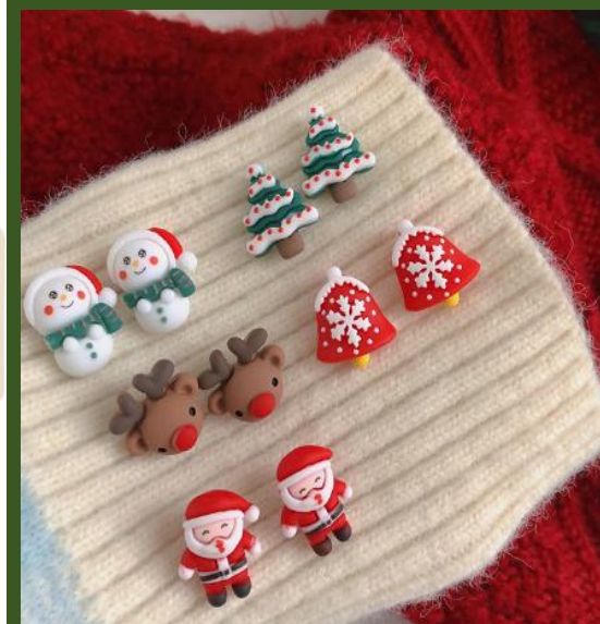
NH10041454 Ventes 564