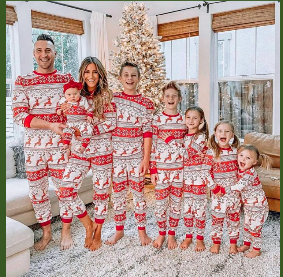
NH10035129 Ventes 166

https://www.nihaojewelry.com/fr/tenues-assorties-pour-la-famille