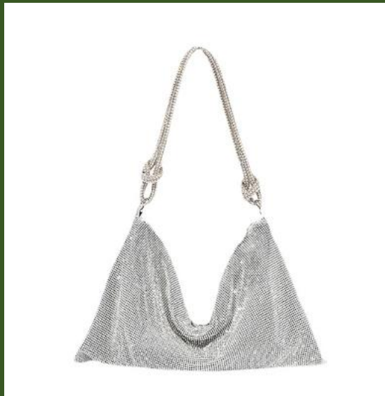
ND853007 Ventes 158