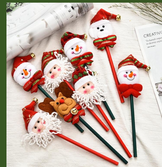
NH10062664 Ventes 91