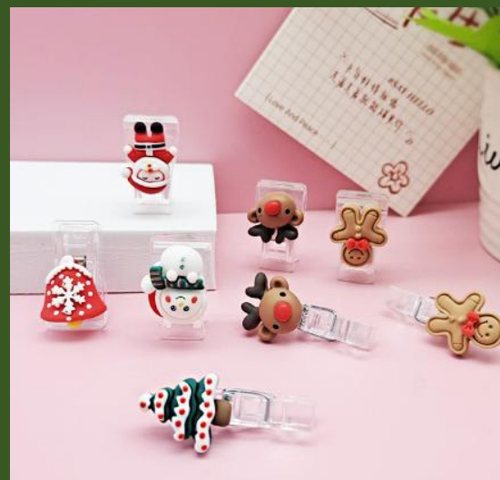
NH10057282 Ventes 95