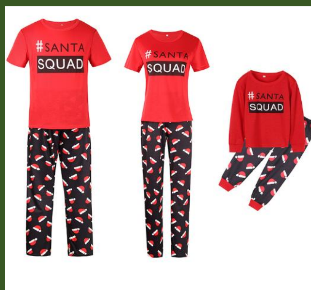
NH10041255 Ventes 98