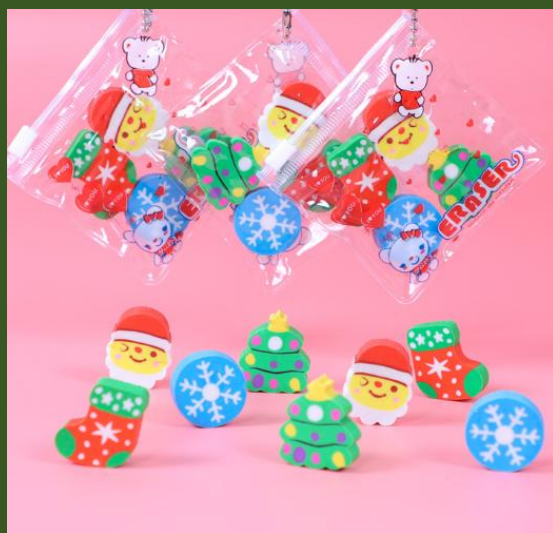
NH10040640 Ventes 327