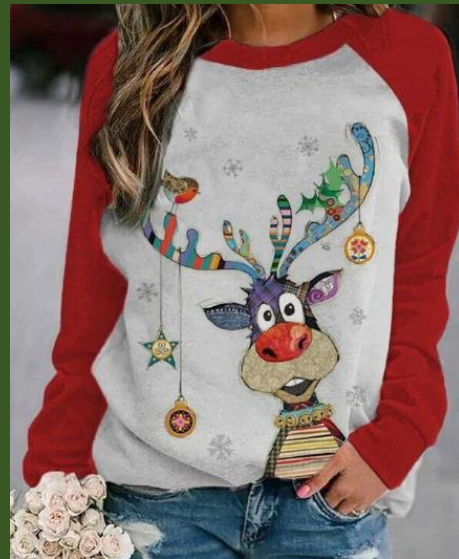
NH10005651 Ventes 114