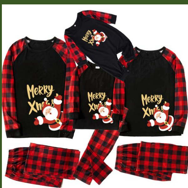
NH10030391 Ventes 110