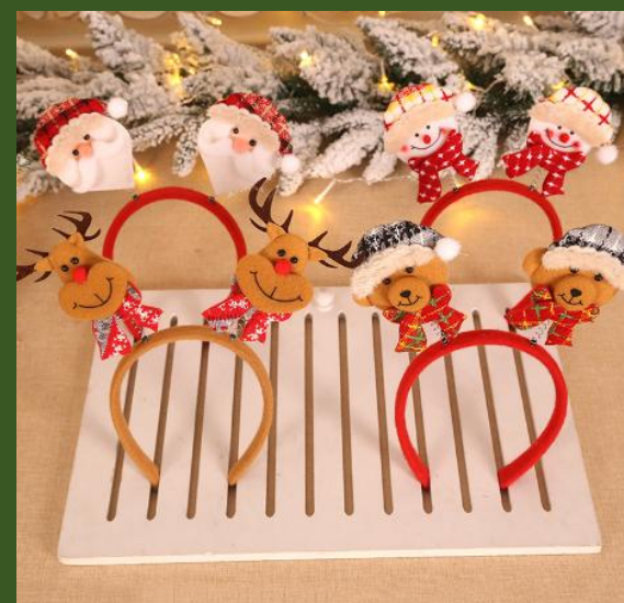
NH10049222 Ventes 112