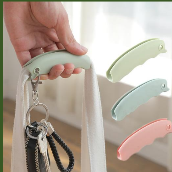
NH10083605 Ventes 106