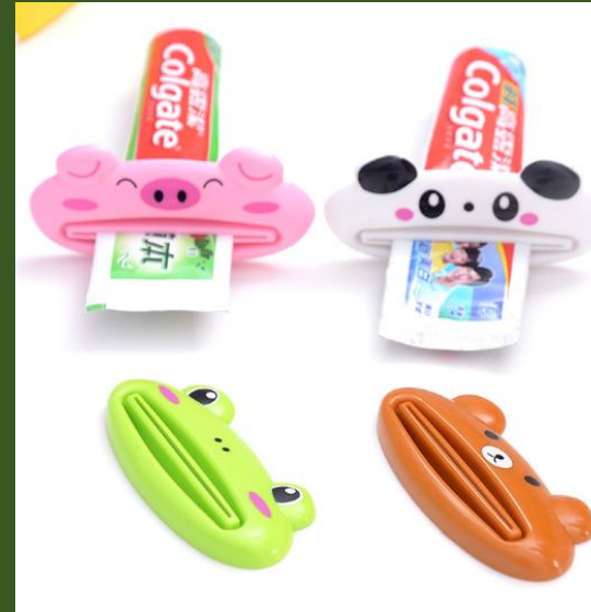
NH10081499 Ventes 86