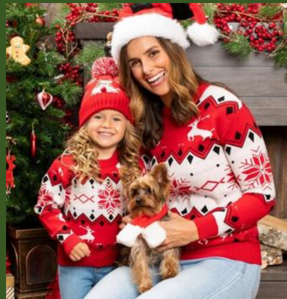
NH10079591 Ventes 75