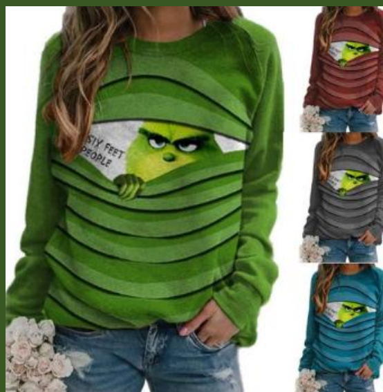
NH1005531 Ventes 114