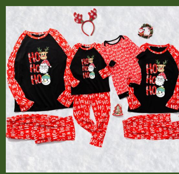
NH10030397 Ventes 96