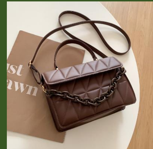
NH839452 Ventes 175