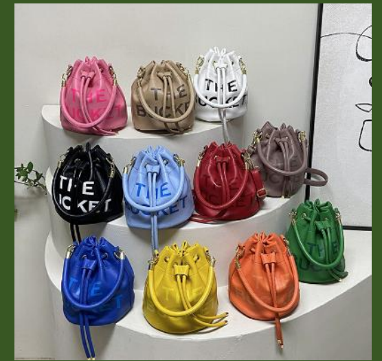
NH10037307 Ventes 298