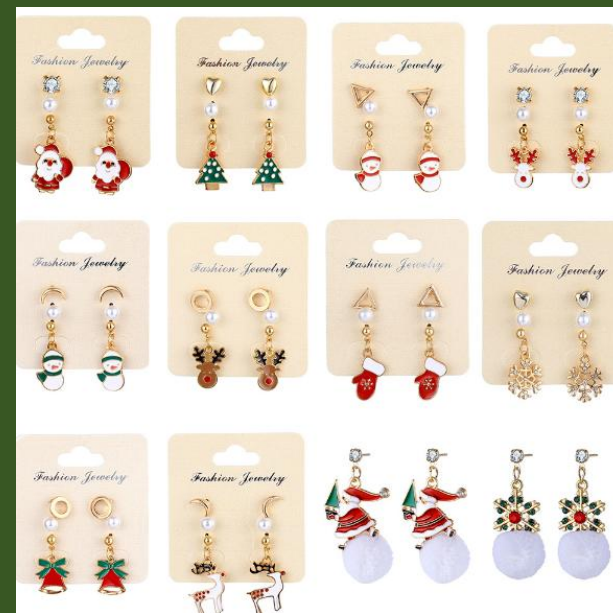
NH835228 Ventes 427