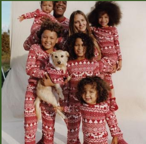
NH10035127 Ventes 166