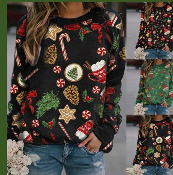
NH10051400 Ventes 122